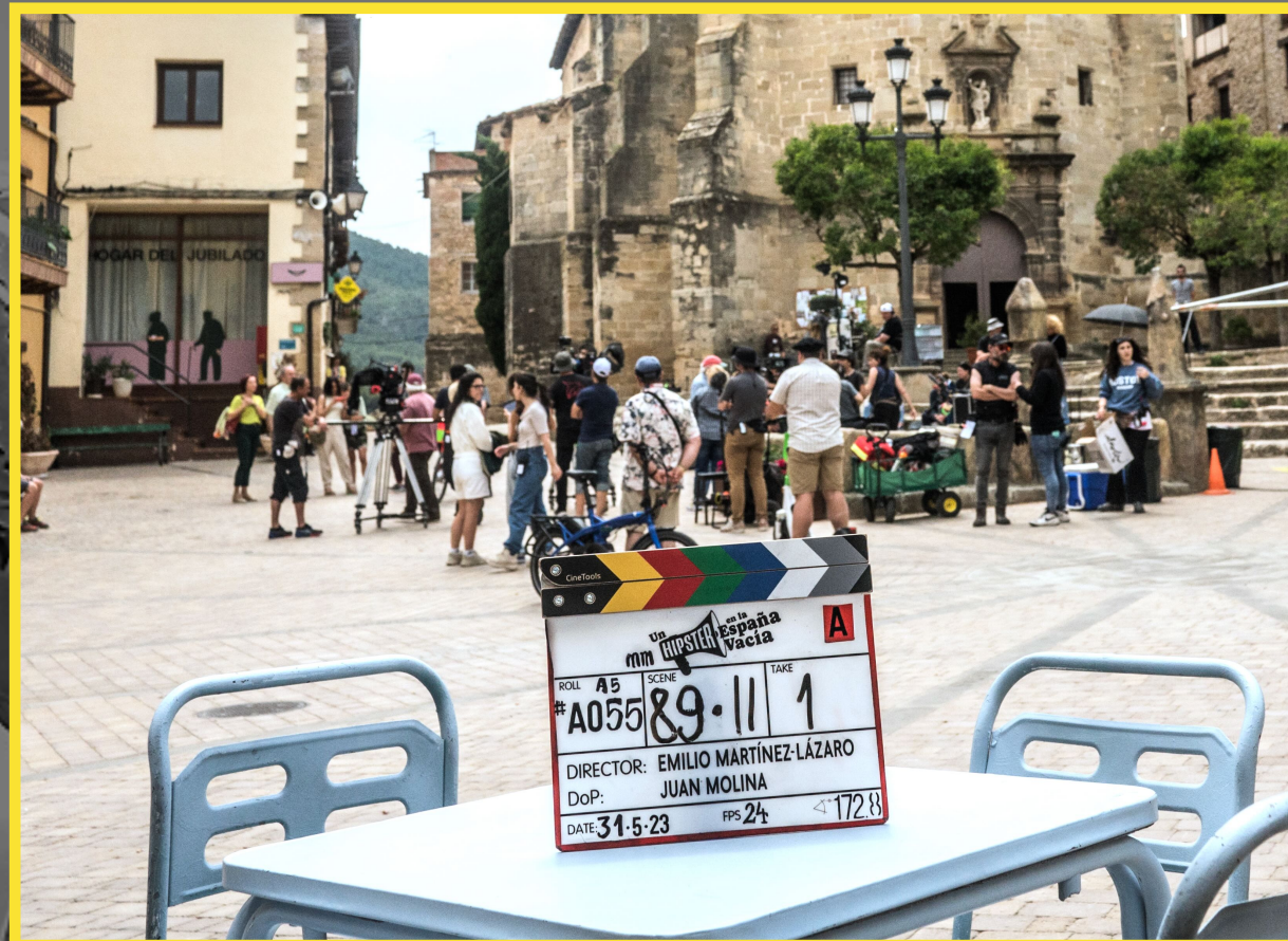
Un hípster en la Espacia vacía Emilio Martínez Lázaro