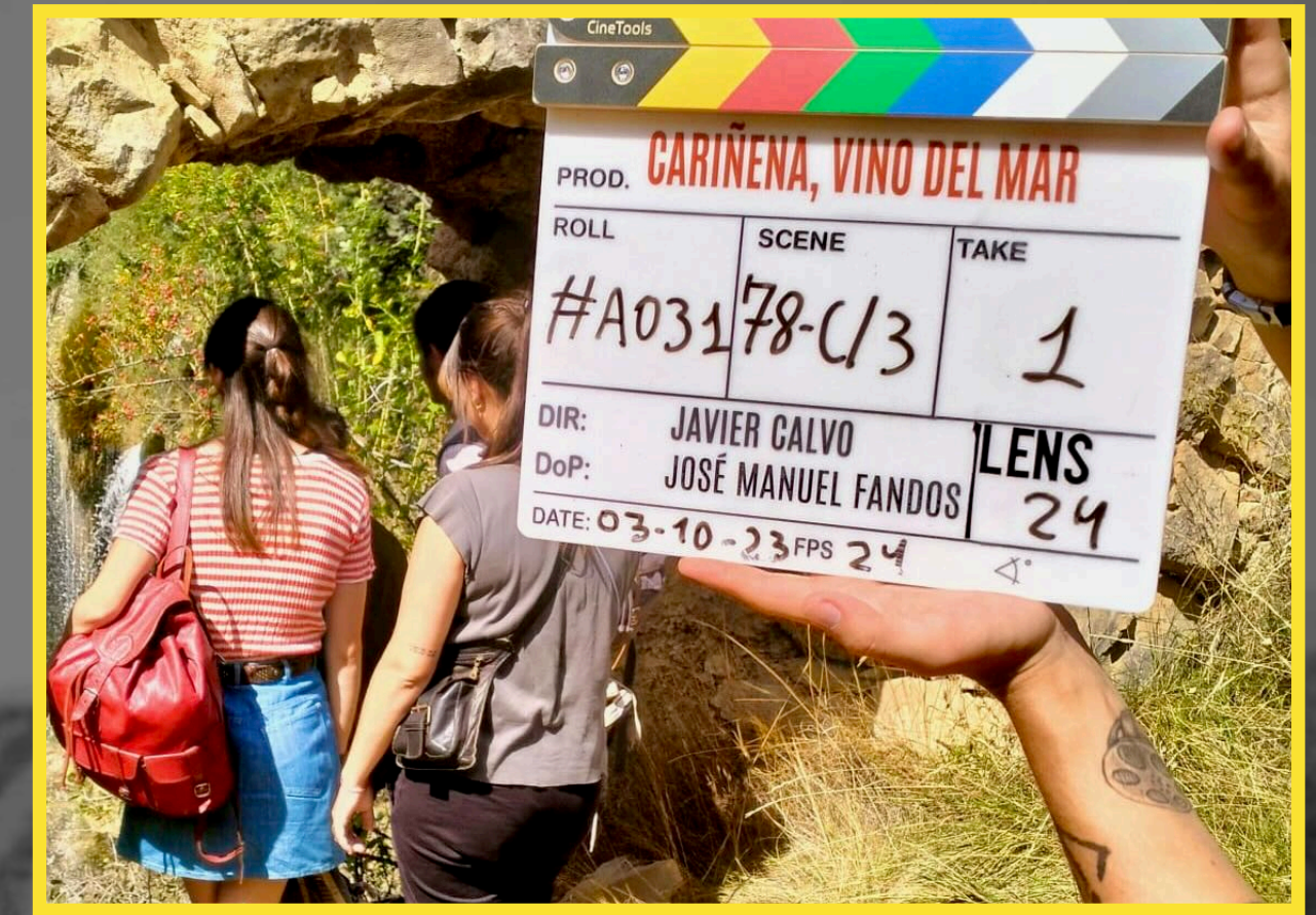
Cariñena, vino del mar Javier Calvo